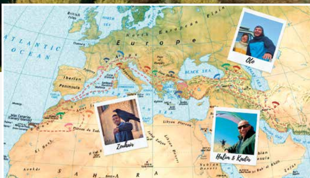
Fahrt dem armenischen Sewansee entlang.