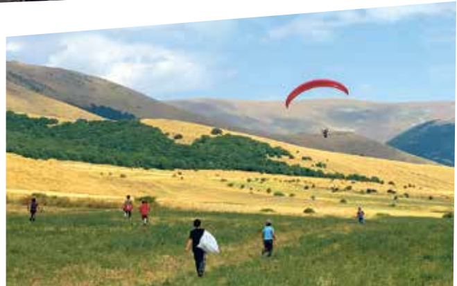
Stürmisches Willkommen am Landeplatz. Nuages d'orage à l'atterro.

Comme nous voyageons sans but ni planning, bien des choses se font naturellement, notamment les rencontres liées au vol libre. Un jour, nous demandons à de nouveaux amis s'ils connaissent des pilotes dans les alentours, un autre jour, on nous dirige spontanément vers les amis de libéristes. À chaque fois, nous agrandissons un peu plus le cercle de notre famille