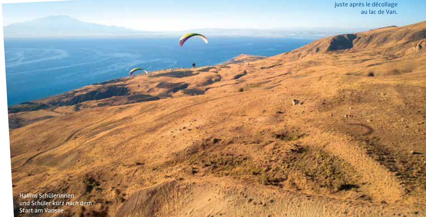
Halims Schülerinnen und Schüler kurz nach dem Start am Vansee.

Les élèves d'Halim juste après le décollage au lac de Van.